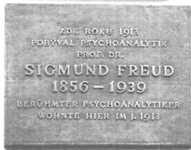
Pamětní deska S. Freuda v M. Lázních.