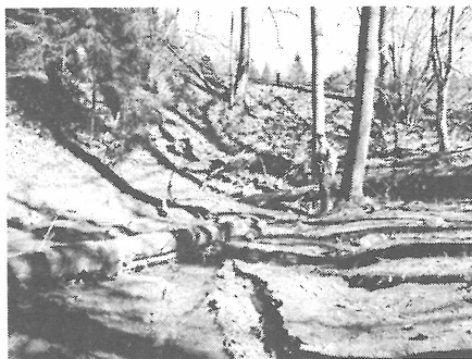
Místo krasového propadání.

Bývalá vesnice Grafengrün leží necelé tři kilometry východně od vrcholku Dyleně (939 m.), na stráni mírně se svažující k východu. Západní a jižní strana obce je lemována rozsáhlými lesy, 2 kilometry východně stával opevněný dvorec s názvem Kocovský dvůr (Kotzauerhof 630m.) a ještě kilometr dál osada Jedlová (Tannaweg 604 m.). Dva kilometry severně od Grafengrünü je osada Vysoká (Maiersgrün 662 m.). Osídlení na katastru obce Háj bylo ve výšce zhruba od